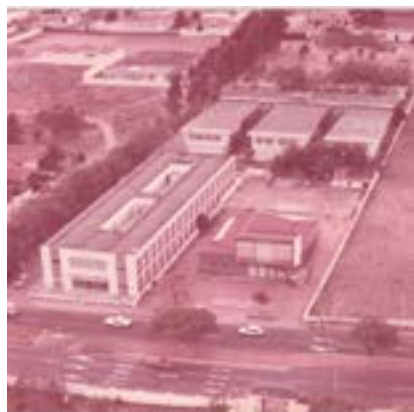
Acima, vista aérea do Museu Câmara Cascudo com fachada original, abaixo fachada atual.