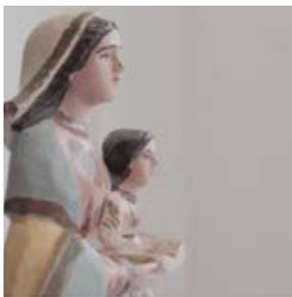
Título: Santana Mestra Autor: Desconhecido

Acesso: museudoseridoufrn.wixsite.com/exposicao