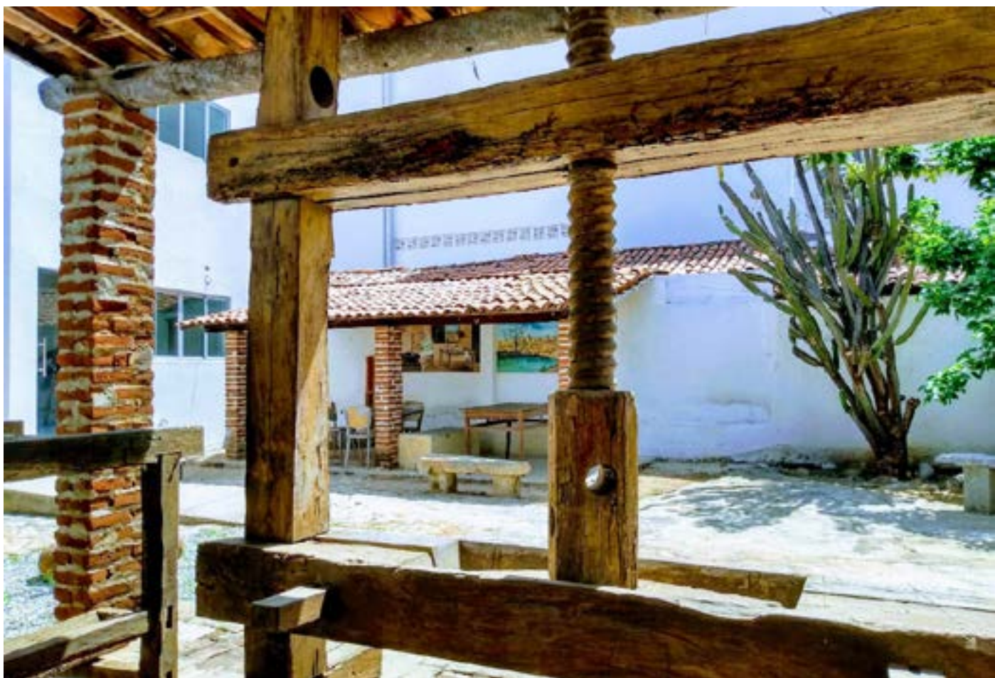
Museu do Seridó da UFRN