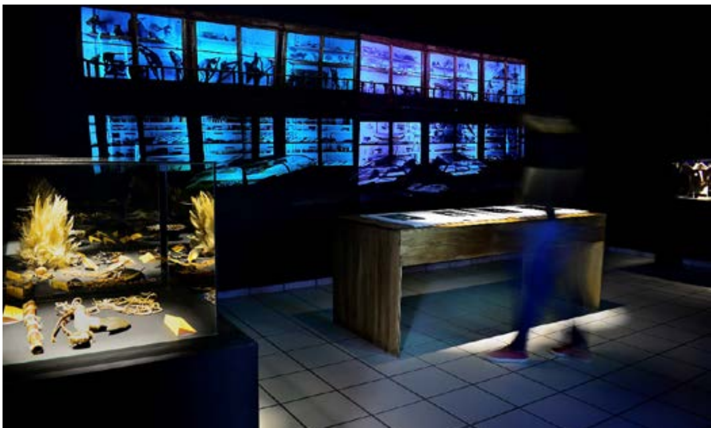
Museu Câmara Cascudo da UFRN